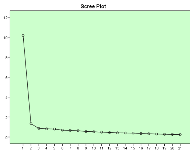
نمودار ۱: آزمون اسکری مربوط به عوامل ترغیب کننده مطالعه

قابل استخراج از آزمون اسکری ۱ استفاده شده است. در شکل زیر آزمون اسکری برای مشخص شدن تعداد عوامل پیشنهادی آورده شده است. بررسی شکل زیر نشان می‌دهد که تعداد چهار یا سه عامل برای عوامل ترغیب کننده مطالعه مناسب است.